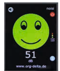
Anzeige als Smileys

Die Grundeinstellung ist die Smiley-Variante, die neben rot, grün und gelb beim Zurückschalten zusätzlich einen zwinkernden Smiley zeigt. Dieser vermittelt die Botschaft: Gut gemacht!